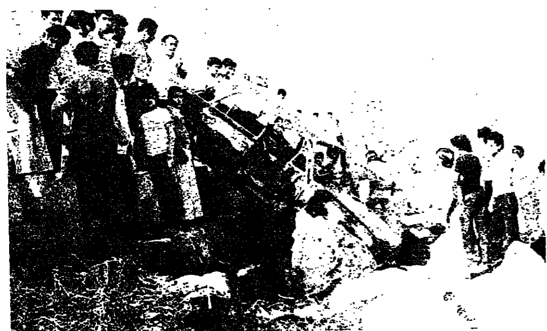
سيارة تدهورت قرب «مخيم اليبس» بعد اصابة سائقها برصاص العدو